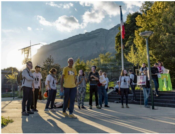
Des militants de divers collectifs se sont rassemblés à Saint-Ismier ce lundi 29 septembre pour protester contre l'artificialisation des terres agricoles à Bernin et à Pontcharra.

Emmanuelle Dufféal – Hier à 21:22 | mis à jour hier à 21:28 – Temps de lecture : 3 min